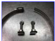
締め付けバンドと連結ボルト