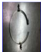
2個装着でも1セット