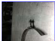
バンドに通します