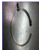
1個装着でも1セット