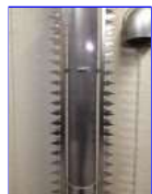
ギザギザハートを2本取付